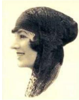
Resim 1. Mihri Müşfik (Bal, 2015, s.385)

Ressam Mihri Müşfik, 1886'da İstanbul'da doğmuş olup, Tıbbiye Nazırı Rasim Paşa'nın kızıdır (Bardakçı, 2015). Mihri Müşfik, özel eğitimle müzik, edebiyat ve resim dersleri almış, resme ilgisi nedeniyle bu alana yönelmiştir. Saray ressamı Zonaro'nun atölyesinde resim eğitimi alan