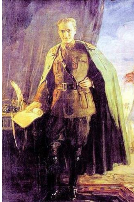
Resim 5. Atatürk'ün Mareşal üniformasıyla portresi (Akçay,2015, s.48)

Mustafa Kemal Atatürk'ün ilk yağlı boya portresini çalışan Türk ressamı da Mihri Hanım'dır. Yunan askerlerinin denize dökülmesine teşekkürlerini sunmak için Atatürk'ün bir portresini yapmak ister. Mustafa Kemal Atatürk Mihri Hanımı davet eder ve Mareşal kıyafeti ile poz verir. Resim üç metre boyunda yağlı boya tekniği ile yapılmıştır (Akçay, 2015, s.44-48).